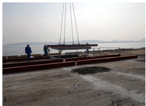
既設床版撤去状況

棧橋撤去工事の足場に使用した鋼材は、使用後も現場内で溶断、加工することによって足場材として繰り返し再利用した。