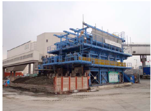
排泥処理プラント

地盤改良（高圧噴射攪拌工法）では、固化材を高圧で噴射し、地盤を切削しながら混合攪拌する工法であるため、余剰となった泥分が汚泥（廃棄物）として排出される。通常、地盤改良工事で発生する汚泥はそのまま産業廃棄物として委託処理されるが、同工事では、地盤改良によって発生した排泥を、排泥処理プラントでふるい分け、泥水と礫分に分別し、泥水は脱水した。これにより、汚泥を約 50%削減することができた。