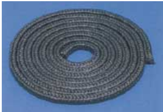
角打グランドパッキン