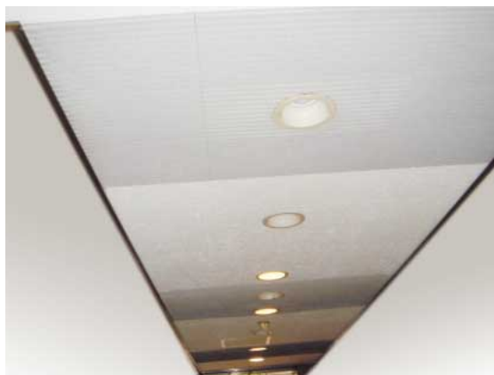
リップ付き岩綿吸音板