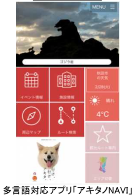
多言語対応アプリ「アキタノNAVI」