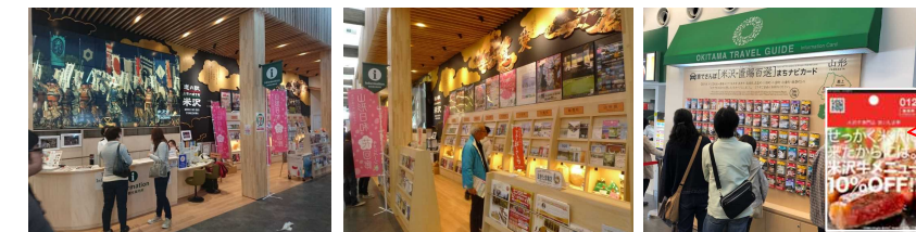
▲総合観光案内所(JNTO外国人対応) ▲県内市町村の観光案内 ▲市内のお店クーポン等を紹介