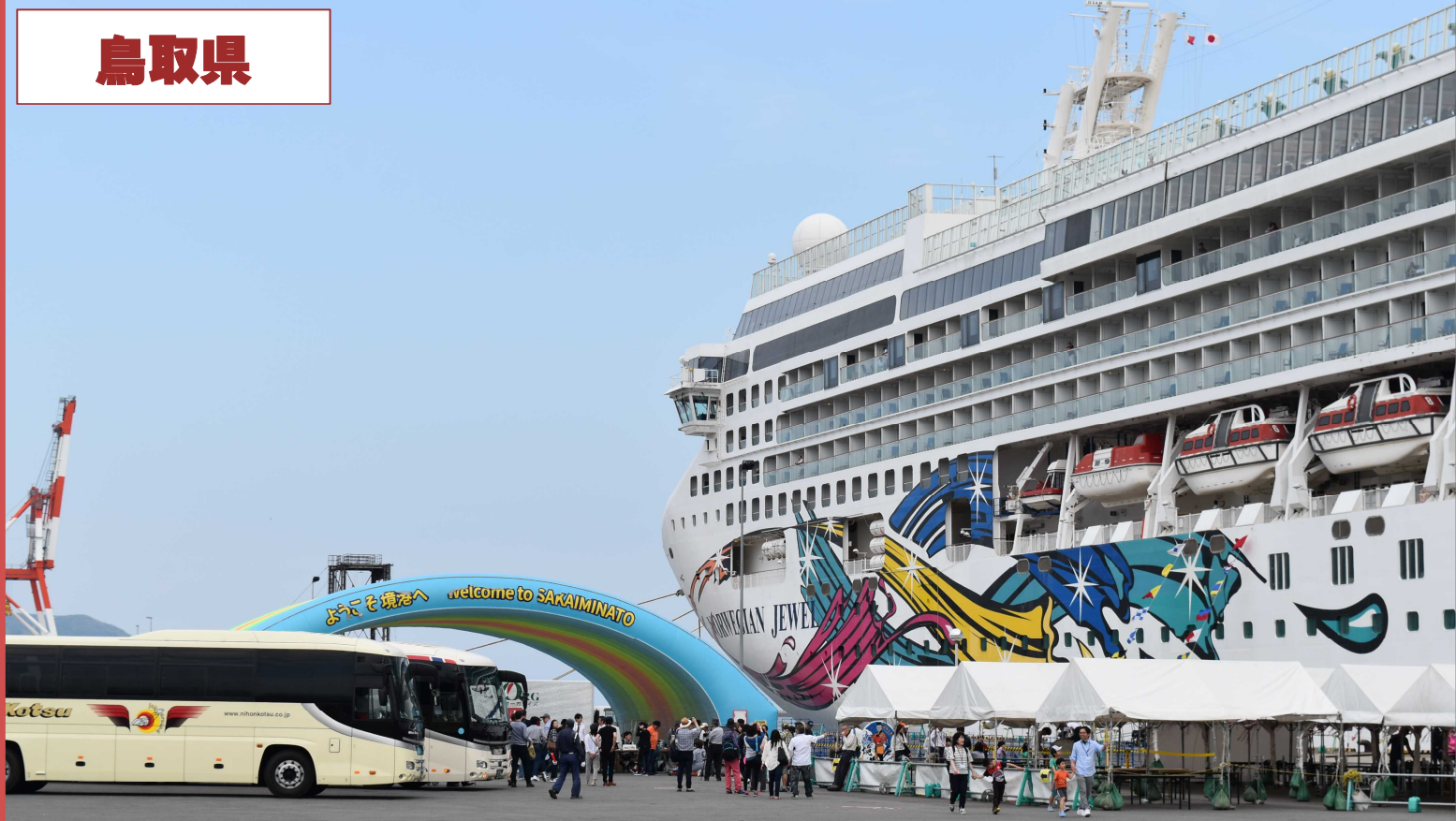
境港への外国からの大型クルーズ客船寄港