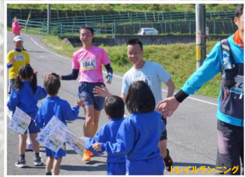
トレイルランニング

ダム湖でさくらおろち湖祭り、レガッタ、トライアスロン。周辺道路ではウォーキング、自転車競技大会を開催。 ダム周辺の地形を利用したトレイルランニング、ロゲイニング、クレスト点検放流と多くのイベントを開催。