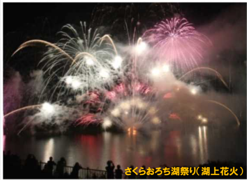
さくらおろち湖祭り(湖上火花)