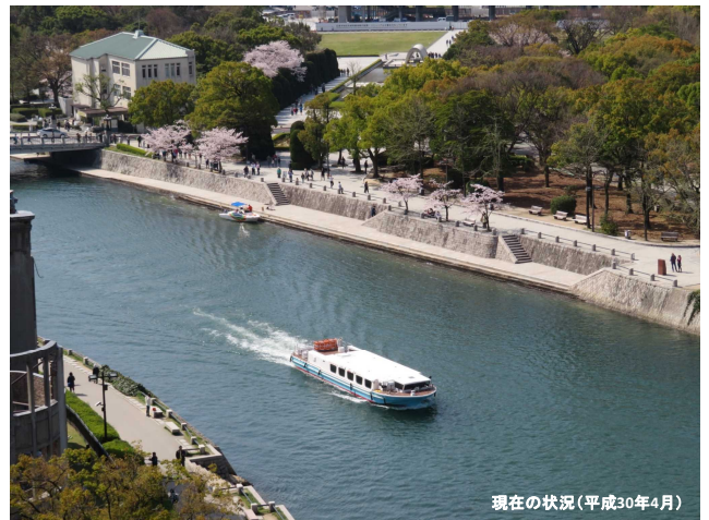
現在の状況(平成30年4月)