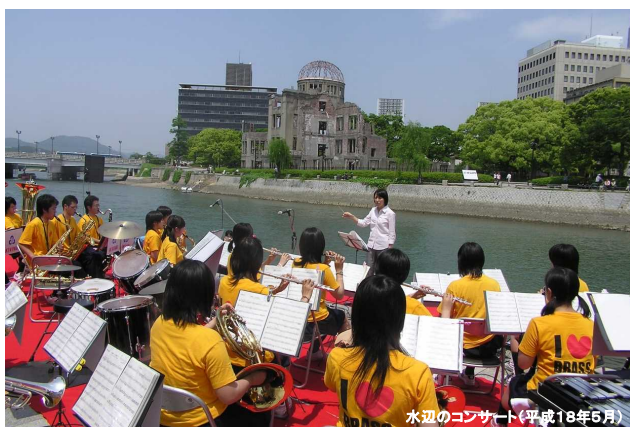
水辺のコンサート(平成18年5月)