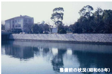
整備前の状況(昭和63年)