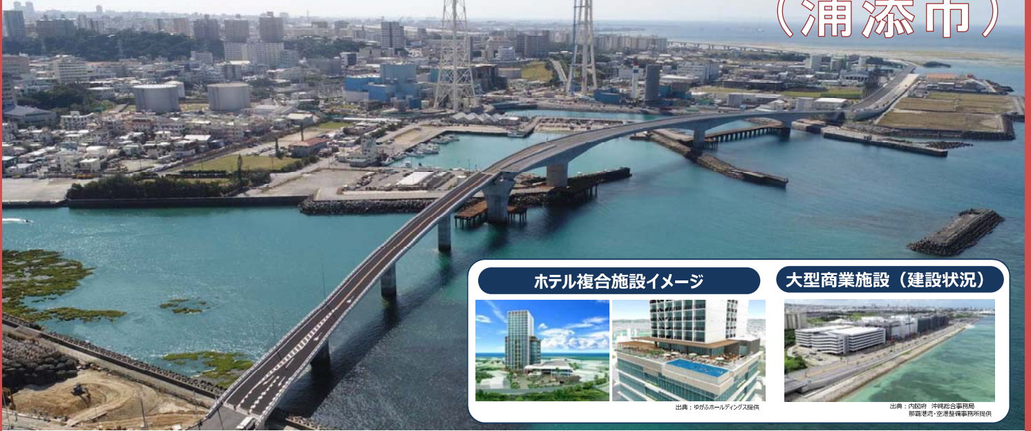
ホテル複合施設イメージ