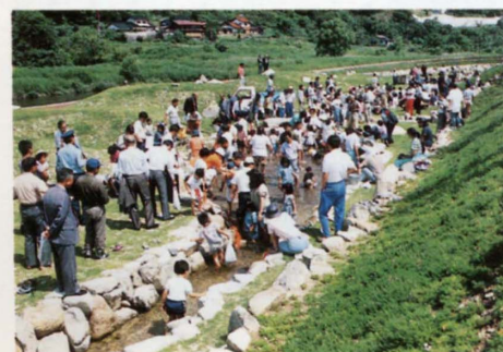
魚つかみ大会などの会場にも利用される