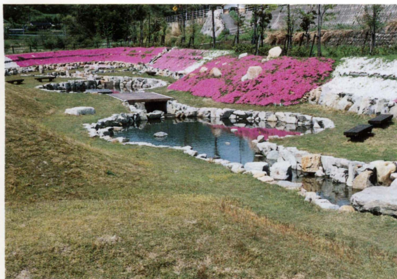
潤いのある植栽が施された園内の池