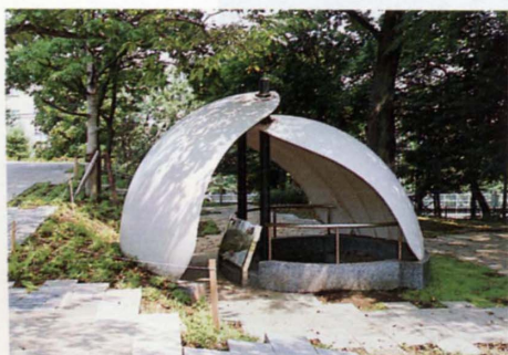
一對の貝殻をモチーフにした貝塚展示ブース