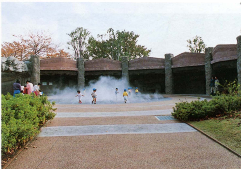
霧状の噴水を発生させ幻想的なムードを演出する縄文の広場