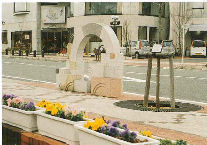
四季(秋)をイメージしたストリートファニチャー 沿道はインターブロッキング舗装