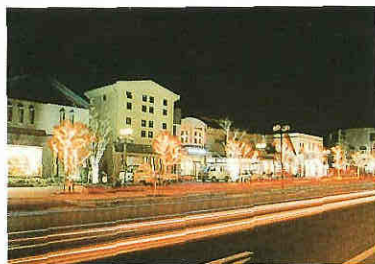
情緒ある夜景を演出するイルミネーション