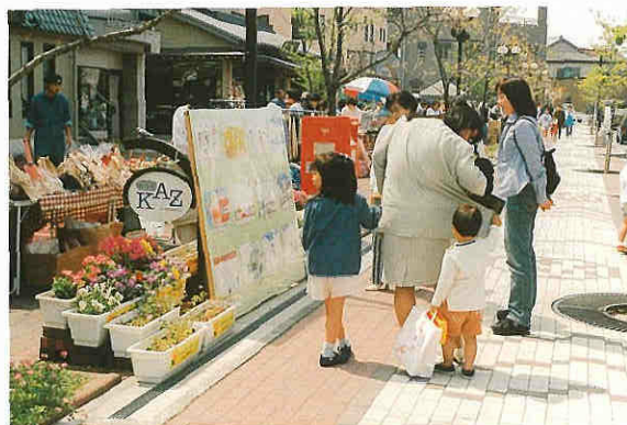
沿道は里親制度による植樹やプランター花壇で潤いのある演出