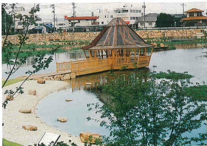
水上に設けられた四阿は野鳥や水性生物の観察にも利用される