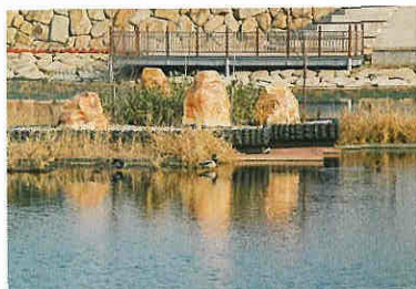
野鳥も多く見られ、生態系も回復してきた