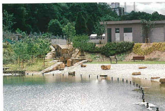
水質浄化施設によって浄化された水は、せせらぎから池へ放流される