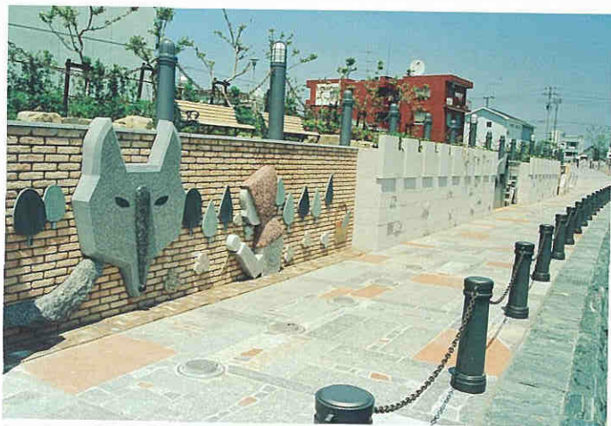
ドイツとの交流の歴史にちなんで整備したグリムメルヘンプロムナード