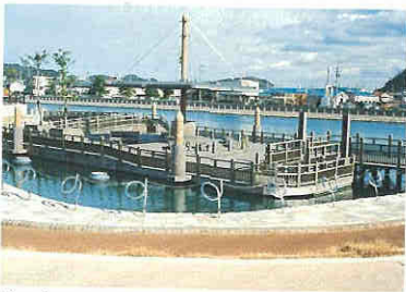
川の中に浮かぶ水辺の棧敷広場