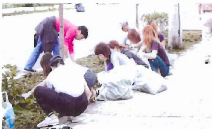
沿道住民主導によるリタロード日常美観活動