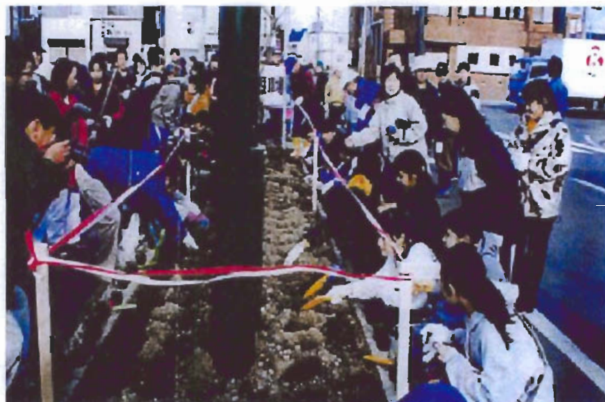
平成11年10月30日開催のリタロード植樹祭

竹鶴政孝氏のウイスキーに賭けた情熱と、氏を献身的に支えたリタ夫人のロマンを後世に伝えるとともに、魅力あるまち並み景観の形成に向けた活動を通して、地域の活性化と住民の意識啓発に寄与している。