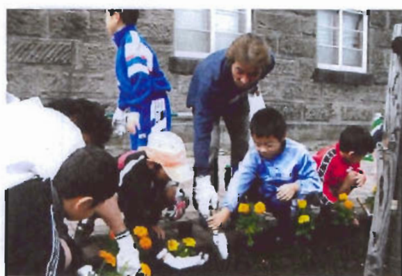
約200名が参加した「ボランティア・サポート・プログラム」制度活用による、平成15年9月6日に実施したリタロード植栽活動