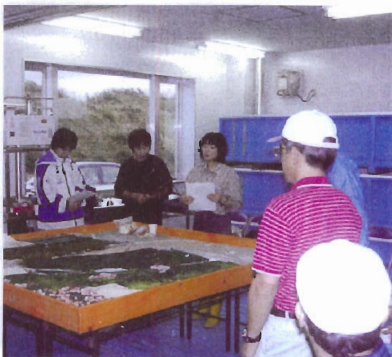
町内の各河川環境活動団体が情報の交換や勉強会を通じて、鶴川河口干潟再生事業として、人工干潟の造成事業に携わり具体的に模型などを活用した事前勉強会の中から、実際に干潟での生物調査やバードウォッチングなどを通じ広く町内外の方への自然環境保全の啓発活動に努めている（写真は模型を使った学習会の様子）