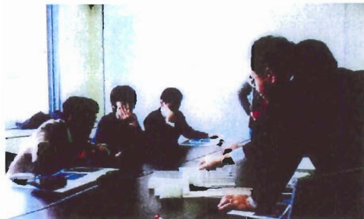
白銀橋自歩道（模型を使って）の検討（住民も参加）