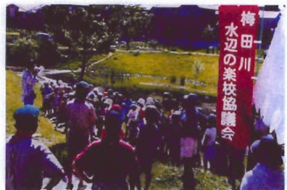
梅田川まるかじり