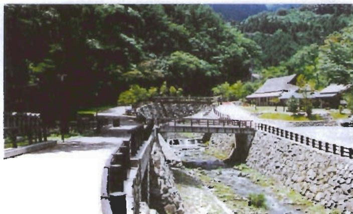
周りの風景と調和がとれている