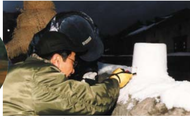
スノーキャンドル（バケツを型とし、中にろうそくを入れた雪の小さなかまくら）に火をつけているところ