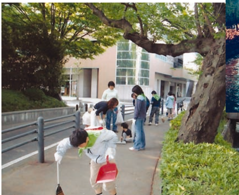
子供たちも参加しての清掃活動

幅広い世代が自分たちの庭のつもりで広瀬川河畔の緑地や緑道を守り育てており、文学散歩に前橋を訪れる人たちにも安らぎを提供しています。この素晴らしい環境を心のよりどころに、今後も活動を続けていく予定です。