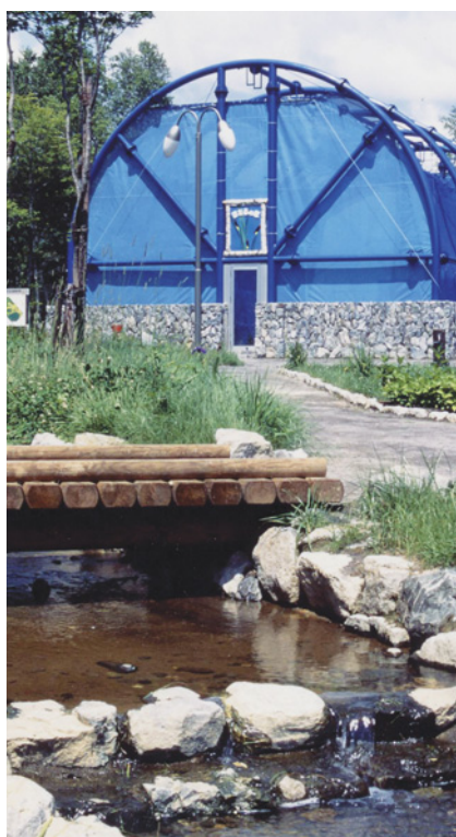
▲ほたるの観賞ドーム

ほたるの里は、沼田町市街地から車で15分程離れた幌新地区にあります。豊かな自然や良好な環境に恵まれ、良質な硫黄鉱泉による温泉施設（ほろしん温泉）や野外活動施設（オートキャンプ場、テニスコートなど）が整備されています。