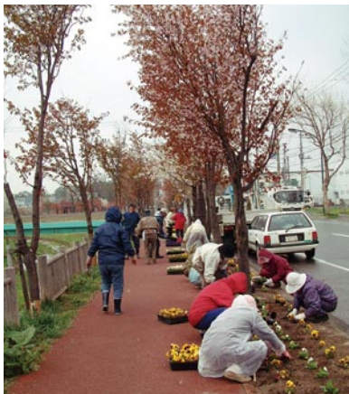
ボランティアによる花植え