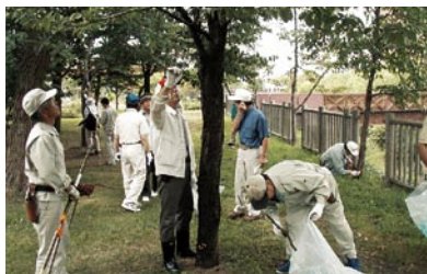
市民の会による桜の育成管理