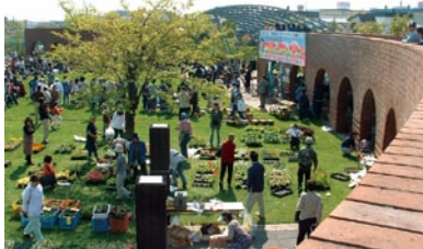
並木道沿線での花市