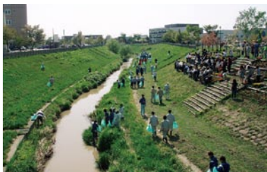
利根別川クリーングリーン作戦による清掃と花植え

作戦の開催により、市民の地域への環境美化への意識の高まりや作戦で収集するゴミの量の減少など、利根別川千本桜並木道の取組が岩見沢市のまちづくりに与えている影響は大きなものがあります。