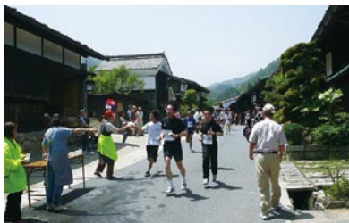
妻籠健康マラソン大会