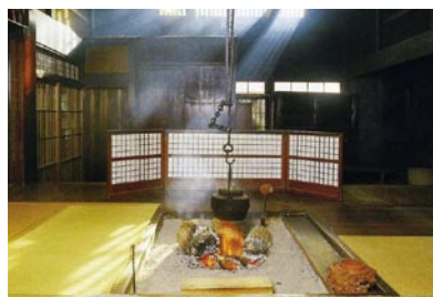
国指定重要文化財「脇本陣奥谷」

昭和43年9月に妻籠全住民を会員に設立された「妻籠を愛する会」が、昭和58年発足の(財)妻籠宿保存財団と組織統一を行い、現在の「財団法人妻籠を愛する会」となり、行政で対処しえない分野の対応をは