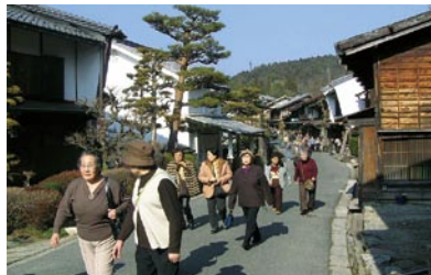
観光客で賑わう妻籠宿