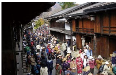
文化文政風俗絵巻之行列

妻籠宿を活用したイベントとして文化文政風俗絵巻之行列、妻籠健康マラソン大会を継続的に実施し多くの参加者を集め、今では地域の行事として定着しています。