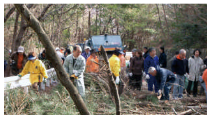
市との合同活動イベントであるヤシャブシの除去作業