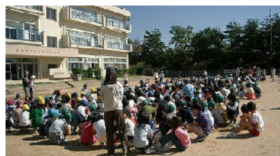
地元の市立桜台小学校にて合同緑化クリーン作戦