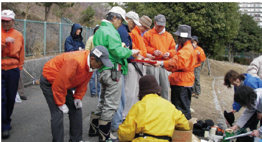
市との合同作業の準備