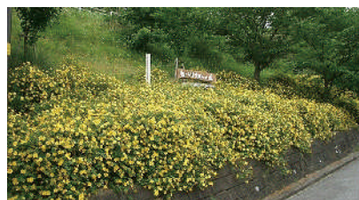
シンボルゾーン「ヒペリカムの丘」