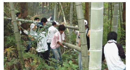
竹灯籠に使用する竹を伐採（里山保全）