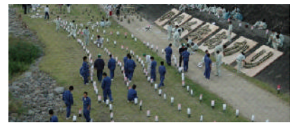
地域みんなで「千年あかり」を準備