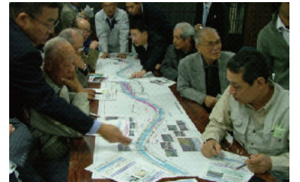
国、市、地域と一緒に実施した川づくり計画