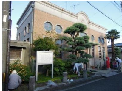
旧郵便局を国の有形文化財に登録