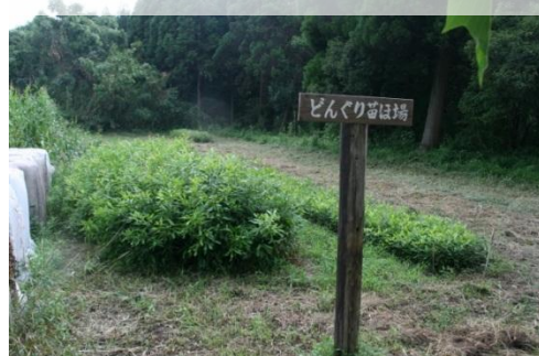
どんぐりの種から育った苗場