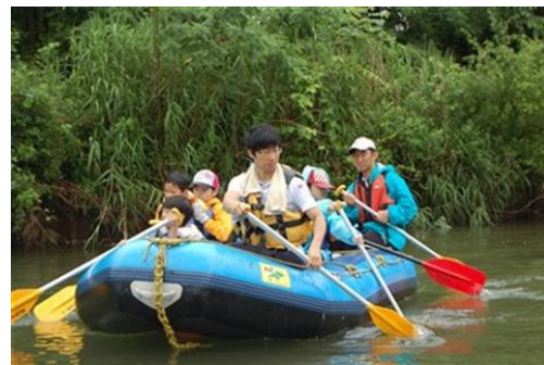
緑と水に親しむ集い