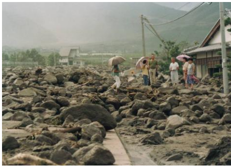
度重なる土石流の被害にあった安中三角地帯

及びそれらの維持・管理を行うほか、地元の高校生の卒業記念植樹等にも関わり、砂防指定地の利活用に積極的に取り組んでいます。また、火山地域の市民団体相互支援ネットワークの一員として、有珠山や三宅島、霧島山(新燃岳)といった火山災害で被災した地域との交流を毎年継続しています。被災地住民の支援の一環として、安中三角地帯高上げ事業を実現した際に、行政を動かすために、あえて住民に厳しい態度をとらなければならなかった体験談などを、被災地域に行きつて伝える活動も行っています。近年では、「安中防災塾」を行政と協働で開催するなど、次世代の防災リーダーの育成に積極的に取り組むなど、「防災」をテーマにした地域づくりに活動の幅を広げています。