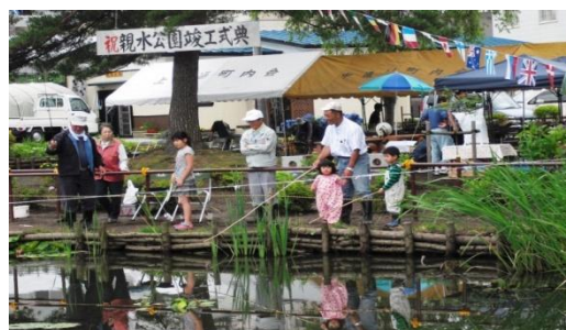
完成した親水公園での釣り風景