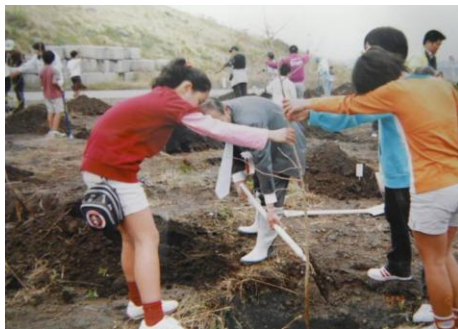
地域住民による植樹