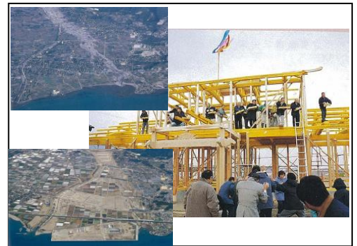
高上げの前後、第一号の棟上げ式