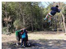
ハジブラコで遊ぶ子供達