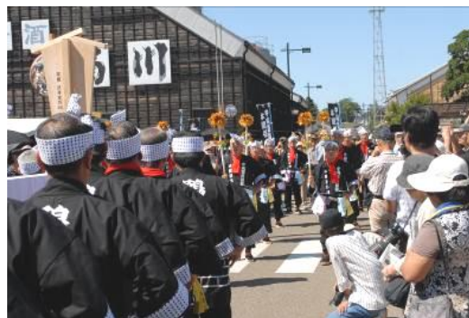
木遣り音頭を復活させた木遣保存会