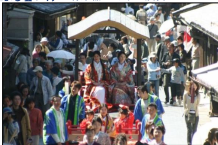
かぐや姫が町並みを練り歩く「かぐや姫パレード」（たけはら竹まつり）