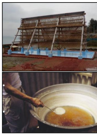
流下式塩田の再現による塩づくり