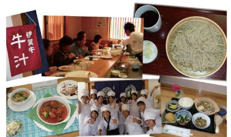
目指せ開業 ワンディレストラン事業