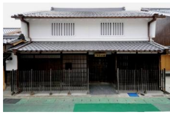
やなせ宿 江戸～明治時代の町屋建築を改修