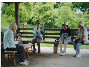
地域の憩いの場として活用