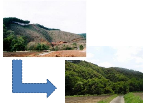
植樹から10年後に沢が流れ始めた