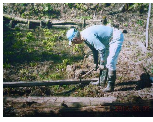
ミズバショウの植生