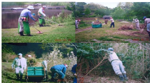
環境保全活動風景

次世代に素晴らしい自然を残す取組を継続し、更に「地域づくり」への一役を担っています。