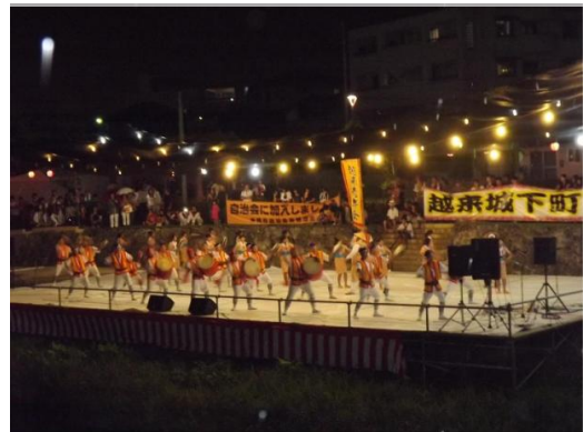
地元青年会によるエイサー演舞