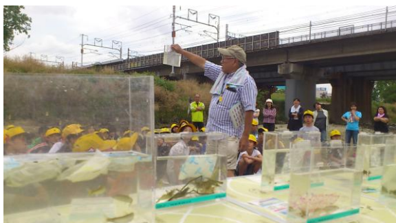
水辺環境を活用した環境学習