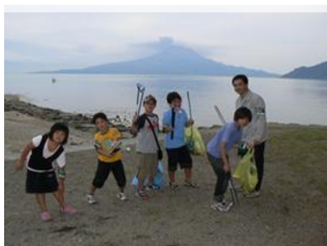
毎日行われるクリーンアップ

た海岸や駐車場は荒れ果て、散策する地域住民の姿も見られなくなっていました。この状況を改善し、海岸に地域住民の姿を取り戻すため、住民と一緒に、ゴミの種類、量と発生場所をデータ化し、ゴミを捨てにくい環境を作り出すなど戦略的な対策を打っていくことで徐々に効果が現れるようになってきました。更に、根本的な解決に至るように重富海水浴場の利害関係者を集めたワークショップをコーディネートし、干潟の重要性を情報発信しながら地域住民の環境保全に対する意識啓発活動も実施しました。その結果、美しい海岸が保たれ、多くの利用者が訪れるようになりました。高齢者や体の不自由な方々も利用される機会が増え、どなたでも干潟体験ができる車いすや施設を導入することで利用者から好評を得ております。