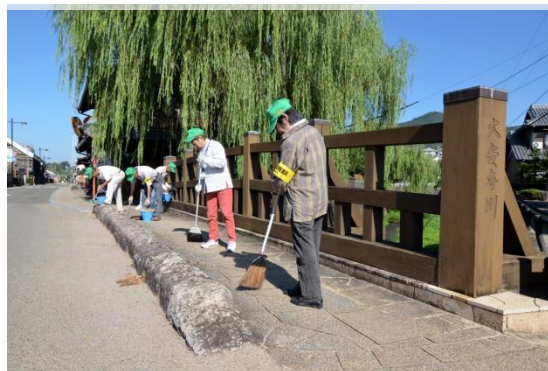
毎月2回行われている清掃活動