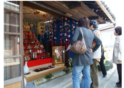
「引田ひなまつり」民家に飾られた雛人形