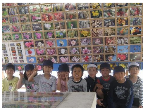
あずまやでの環境学習