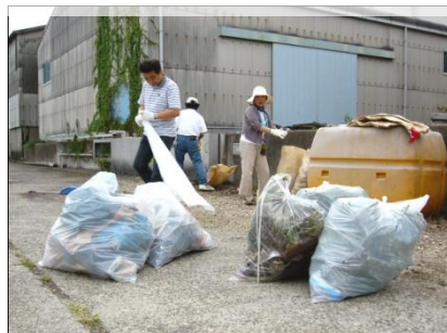
偶数月の第3土曜日はお掃除の日