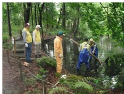
こんぶくろ池の整備作業風景

地域からの依頼による出張工作教室の実施など、こんぶくろ池の知名度も高まり、来園者も年々増加傾向にあります。