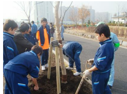
桜のパートナー制度