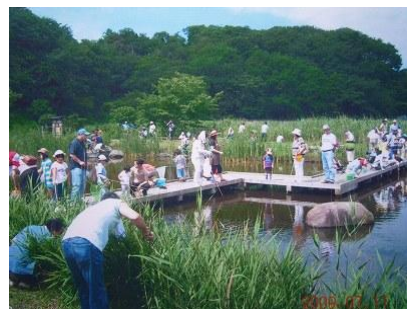
ザリガニ捕り大会