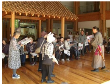
町産材の役場にてボランティアガイド