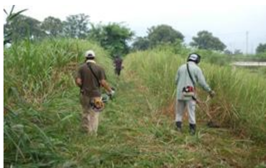
草刈り・清掃活動

現在では、環境保全団体等からなる「安曇野環境市民ネットワーク」に加入し、環境学習プログラムの企画や、地域に貢献できる人材の育成等について他団体とも連携を図るなど積極的な活動を展開しています。