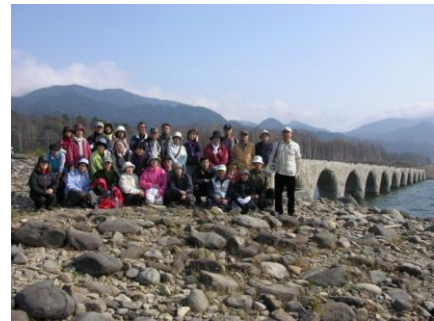
アーチ橋を巡る遠足などを開催