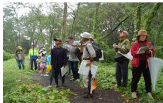
三角島自然観察会