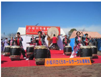
小松川千本桜まつり