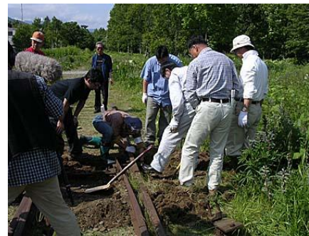
旧幌加駅での鉄路の復元作業風景