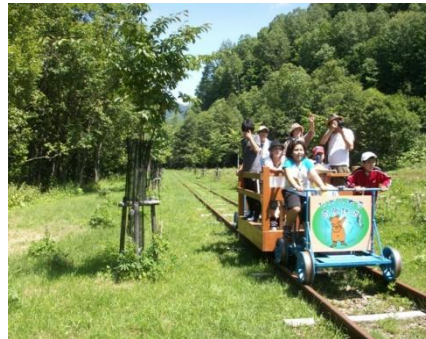
鉄路を再現して運行しているトロッコ列車