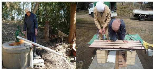
災害に備え、新たに手押しポンプとカマド型ベンチの設置