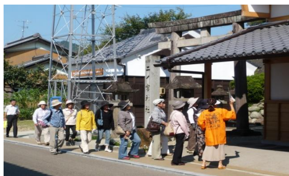
ボランティアガイド