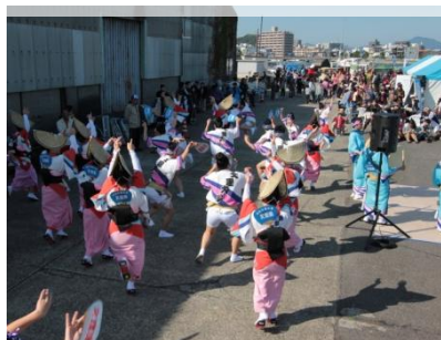
万代中央ふ頭で「阿波おどり」イベント

また、イベント活動に留まらず、まちづくりに関する先進事例の調査や勉強会、ワークショップの開催、定期的な清掃活動も地道に続けています。さらに、県や市との実証実験に参加し、遊休倉庫のひとつに事務局およびコミュニティスペース「第二倉庫 アクア・チッタ」を平成23年にオープンし、積極的に各種メディアへの広報活動を行っています。幅広いPR活動に取り組んだ結果、約1年間で1万人以上の来場者があり、最近では他団体との連携がスタートし、水上交通を使った共同開催イベントなど、ますます活動の輪を拡げています。