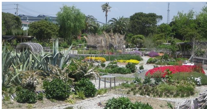
御前崎エコパークの全景

これらの手づくりの創意工夫による継続的な活動により、御前崎エコパークは明るく安全な公園に生まれ変わり、地域の宝ともいえる場を生み出し、市民の憩いの場となっています。