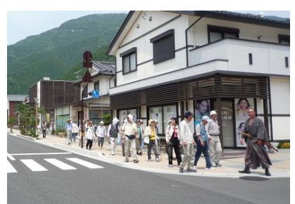
まち中工区にてボランティアガイド