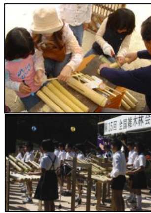
竹楽器づくりと演奏