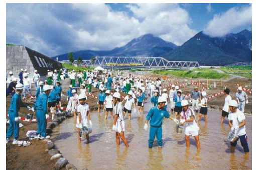
多くの住民が関わった「われん川」の再生