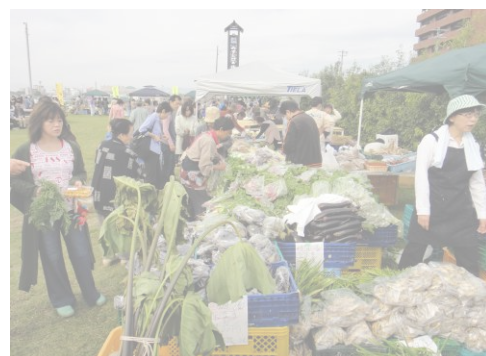
みずとびあ庄内朝市で賑わう様子