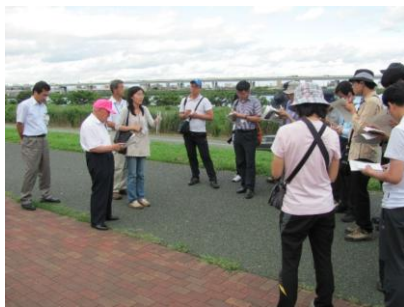
海外からの視察者へ魅力を説明

地域の防災拠点である都立大島小松川公園とも隣接しているため、防災訓練や地域のイベントなどの地域活動に接する機会があり、地域のシンボルとして広く認識されています。