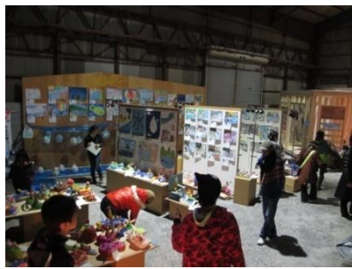
倉庫全体を使った展覧会イベント