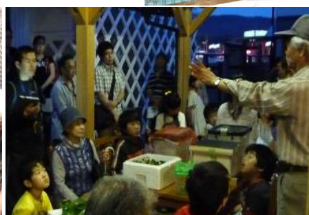
地域の人を講師として迎えるホテルの鑑賞会