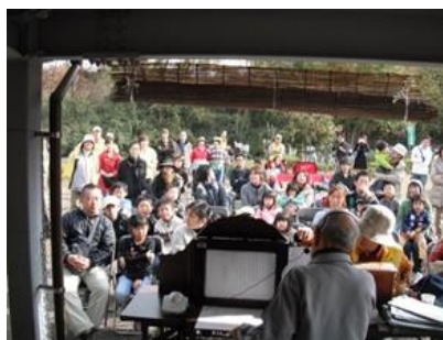
秋のこんぶくろ池祭り