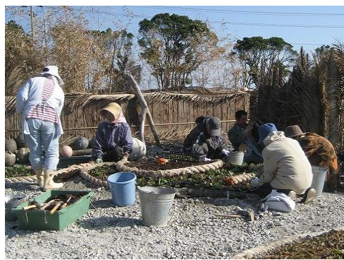
漁具を再利用して公園を整備