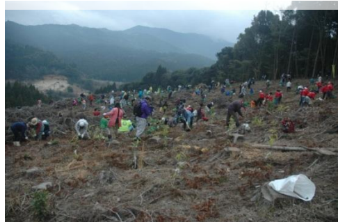
毎年1回行われる植樹会

活動の結果、県内では知名度が高まりつつあり、最近では、森づくりの重要性を下流域に住む方々にも理解が得られ「どんぐり株主」が増えてきています。1000年というスケールを見据えて、豊かな地域環境を自分達の手で築きあげていくという試みが波紋を呼び、着実に活動の裾野が広がってきています。