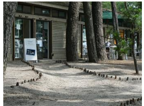
気持ちを癒してくれるマツボックリロード