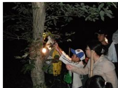
カブトムシ観察会