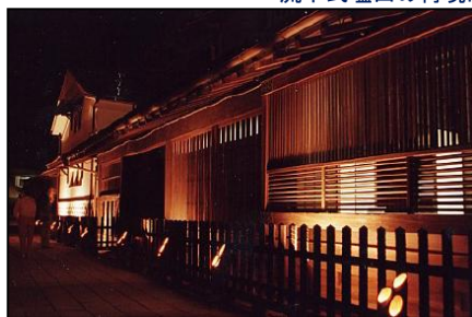
竹灯りによる幻想的なライトアップ（たけはら憧景の路）