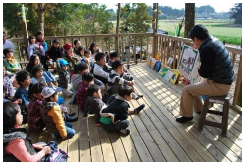
こども自然塾で行われたアナウンサーによる読み聞かせ会