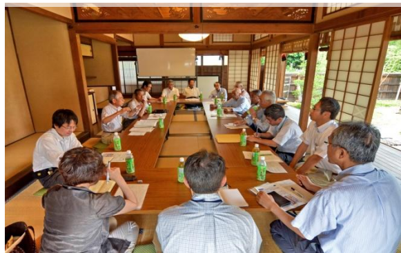
まちづくりの会議

また来訪者に無料で案内をする「中山道鶺沼宿ボランティアガイドの会」や木遣音頭を復活した「中山道鶺沼宿木遣保存会」を組織するなど、地域住民の地域への愛着が高まるとともに、地域の絆づくりや賑わいが創出されています。