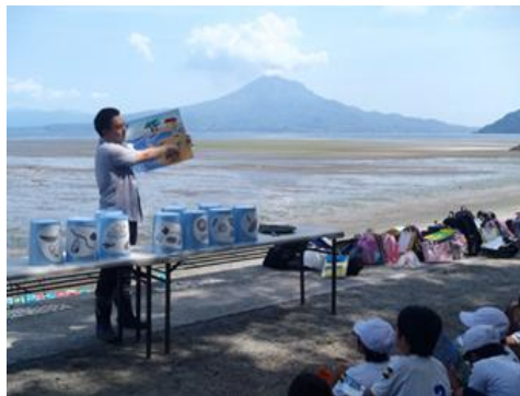
干潟で行われた観察会