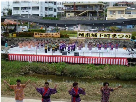
越来城下町まつり (公園内に設置されたメインステージ)

「越来城下町まつり」では、越来城にちなんだ琉球王国衣装を身に纏った王族儀式の再現や、伝統芸能である青年会のエイサーや民謡踊りが行われるなど、若い世代の地域活動の参加にも繋がっており、世代を超えた交流が生まれています。