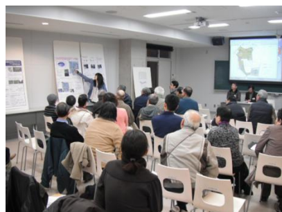
大学生による保全活動報告会