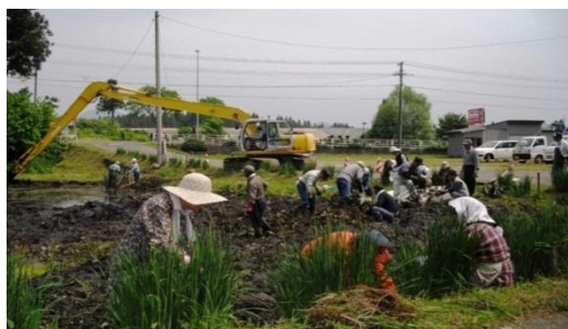
泥沼のヘドロと浮き草の除去作業

その結果、地域の長年の懸案となっていた「泥沼」が、平成24年7月に「親水公園」として生まれ変わりました。「親水公園」の整備を契機に、自主的に活動に加わる住民も増え、池に放流する鮒や鯉を地元の方から寄贈いただくなど当初期待していた以上に活動の輪が広がってきています。ハスの花やアジサイの鑑賞のほか、花火大会や釣り大会等といったイベントにも利用できる地域の憩いの場となっており、親水公園内にはカルガモの親子が住みつくなど、明るい話題も聞こえ、地域住民同士の交流も深まっています。