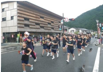
茶堂をイメージした茅葺き屋根風「まちなか」