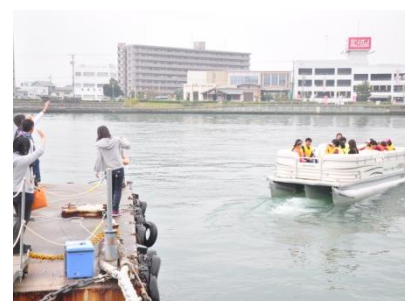
水上交通との連携によるイベント