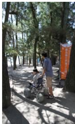
バリアフリーな干潟体験