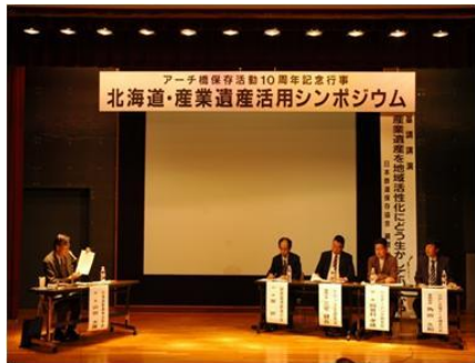
保存活動10周年を記念したシンポジウム