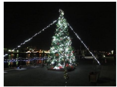
高さ約6mの巨大クリスマスツリー