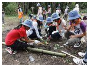
竹で工作中的のガールスカウト