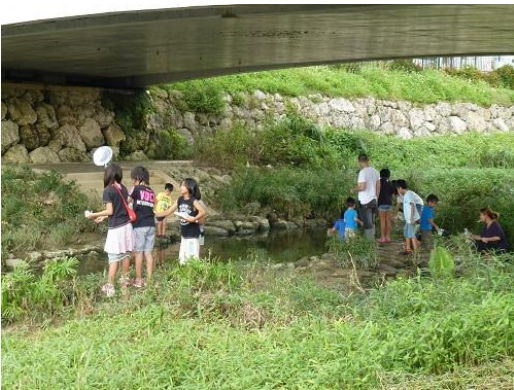
まつり会場付近での川遊び