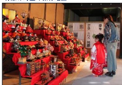
江戸から平成の雛人形を町並みの家々に展示（たけはら町並み雛めぐり）