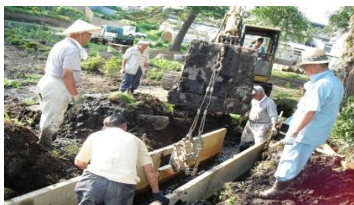
雨水対策のための側溝敷設作業