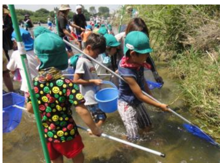
年間を通して自然環境に触れている

環境学習をきっかけに多くの子供達が河川敷を訪れるようになり、また、みずとびあ庄内朝市は7年目を迎え、今ではすっかり定着した催しになっています。市内外からの集客も徐々に増え、行政と住民が連携して多彩な活動を展開することにより、水辺環境への愛着が着実に育っています。