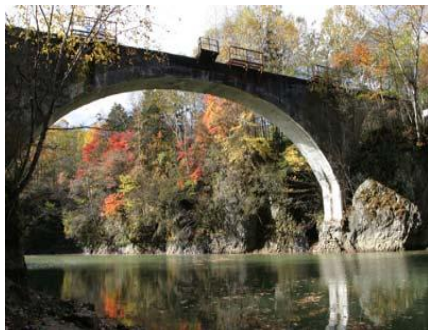
代表的なアーチ橋である第三音更川橋梁

また、アーチ橋梁群は鉄道とともに歩んできた上士幌町の郷土の歴史を学ぶ場にもなっており、地域における文化遺産の保全の枠を越えた広がりを見せています。