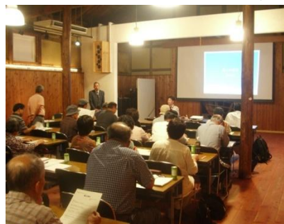
引田の魅力向上勉強会「風の湊会」の開催