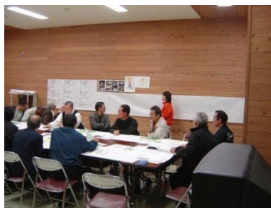
まちづくりのためのワークショップ