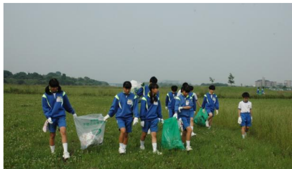
花火大会後の河川敷を清掃する中学生