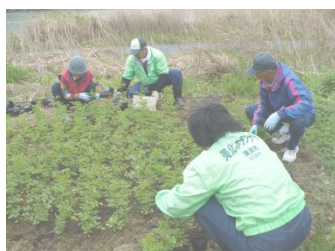
河原撫子を植える協議会員