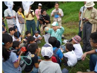
トンボ採取と観察会