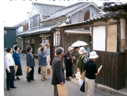
保存会によるボランティアガイド