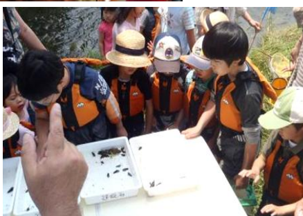
河川レンジャーとの連携による生物観察