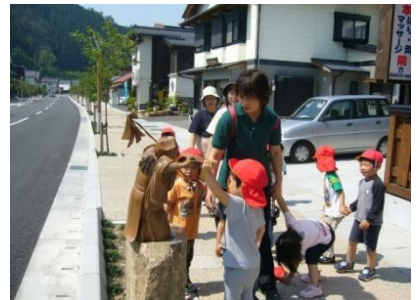
お散歩でも神楽のモニュメントが見守ります