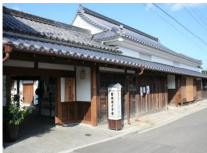
観光拠点として整備された「讃州井筒屋敷」

平成24年2月には、近畿・中国・四国地方から11団体が参加し、第1回瀬戸内ひなまつりサミットが東かがわ市内で開催されました。最近では、更なる地域の魅力向上のため、引田の歴史・文化を再確認するための勉強会「風の湊会」を開催しています。地形、文化財、港の歴史、引田城址、特産物と多岐にわたり、勉強会の成果は記録集として発刊し、市内市外に引田の歴史・文化の魅力を発信しています。