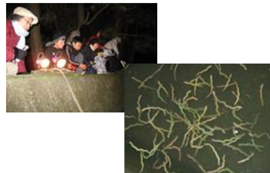
人気エコツアーリズムの「ゴカイ観察会」