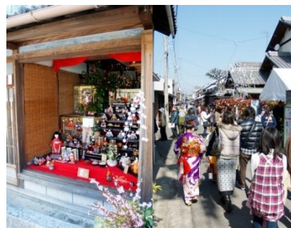
「引田ひなまつり」地域の子供達が参加