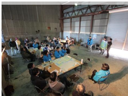
まちづくりワークショップの企画・運営