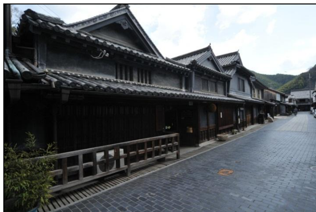
竹原の町並み保存地区

また、風情ある町並みは、映画のロケ地やアニメの舞台にもなりました。これを好機に、竹原を舞台としたアニメ「たまゆら」のイベントを開催したことにより、若年層や家族連れ的话题を呼び、15万人前後で推移していた入り込み観光客数は、平成23年度に約26万人となるなど着実に増えており、地域活性化に大きく寄与しています。