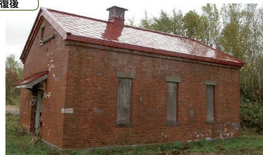
伝統の技「菱葺き」屋根修復完成です