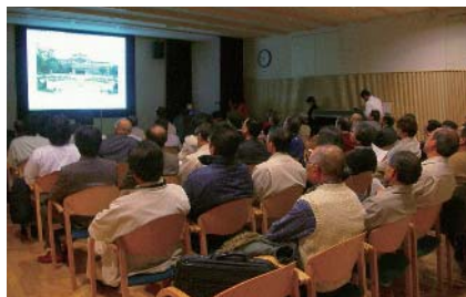
たくさんの方が講座に参加しています

また、調査・研究結果を基にしたガイドブックには載らないような裏話を含めた独自のストーリーが財産となって、各施設のガイドとしての要望も徐々に高まっています。