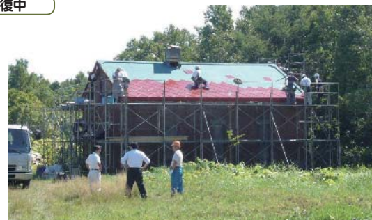
ボランティアの技術者が技術を継承中