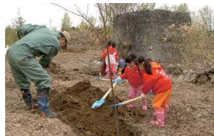
建造物周辺に桜を植樹