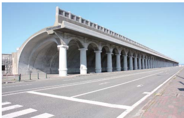
世界的にも珍しいデザインの稚内港北防波堤ドーム