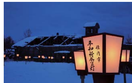
平和を祈念して灯籠を点灯