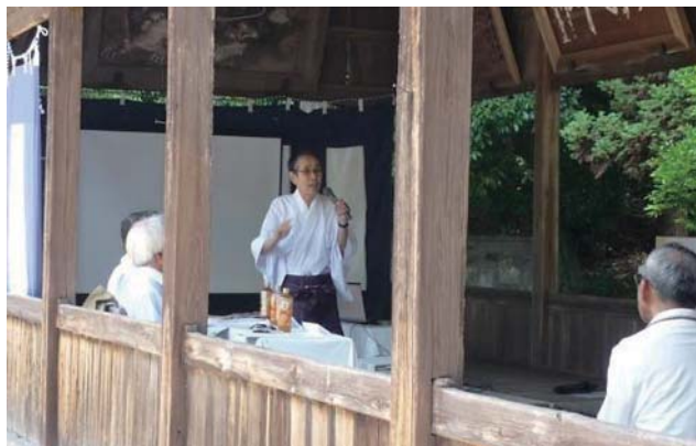
北前船歴史講座の開催状況

坂越地区の文化的・歴史的環境を最大限に生かしながら、伝統ある美しいまち並み景観を「守り、創り、育てる」ことを目指し、活動を行っています。まずは、市民の皆さんにも「北前船寄港地坂越浦」の馴染みが薄かったため、北前船の歴史を理解していただくことから、歴史講座の勉強会を実施しまし