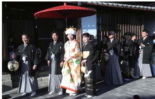
坂越の伝統芸能文化の「坂越の嫁入り」の復活

た。幼稚園児や小学生を対象とした歴史の勉強会も定期的に実施しています。また、昔この地で行われていた「坂越の嫁入り」や「曳きとんど」等の伝統芸能文化を復活させることにより、お年寄りには懐かしさを、子供達には伝統を伝え、周辺のまちには魅力を発信しています。