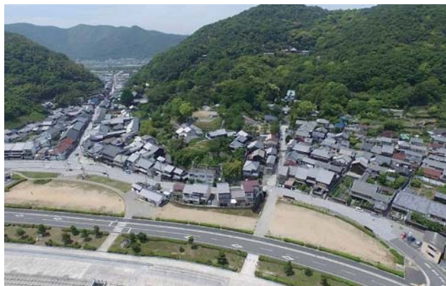
坂越の海岸とまち並みの風景

江戸時代、瀬戸内海有数の廻船業地だった赤穂市坂越。その坂越のまちは、波静かな坂越湾に浮かぶ原生林「生島」を取り囲む山々と、その山裾の海辺に連担する港まちの面影を伝える集落のたたずまいが調和して、絵のように美しい光景を保っています。昔は門が建ち、門番が朝夕開閉して町を守っていた