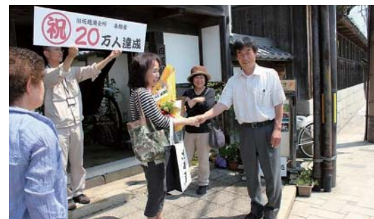
旧坂越浦会所への入館者 20 万人を突破した瞬間

全国各地で開催される「北前船寄港地フォーラム」に出席し、全国の「北前船寄港地」関係者と交流を深めています。