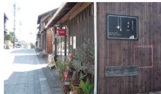
古民家を活用してできたカフェ

所在地 兵庫県赤穂市坂越 活動主体及び連絡先 坂越のまち並みを創る会 http://www.ako-sakoshi.org/ 対象となる社会資本 赤穂市道坂越線・坂越港ふるさと海岸整備事業 ※管理者：赤穂市・兵庫県