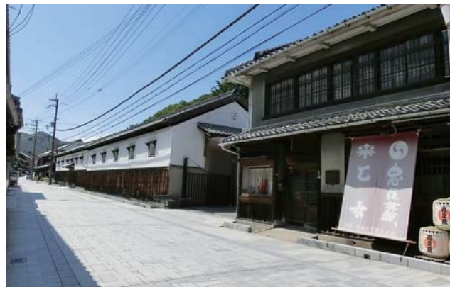
坂越港に通じる坂越大道沿いのまち並み

た「木戸門」跡から坂越港へと続く石畳の坂越大道には、当時の面影を色濃く残すまち並みが続きます。また、安全で潤いのある海岸の創出とまち並みとの調和をテーマに高潮や高波から町を守り、防災機能を十分確保しながら親水性に配慮した穏やかな傾斜の海岸に整備されています。