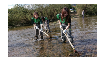
多くの企業の協力