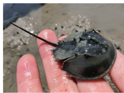
河口干潟に生息するカブトガニ