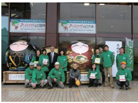
山口駅に大内塗のフシノのお殿様・お姫様の設置