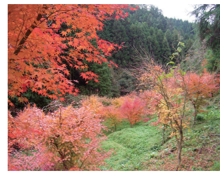
整備した四季の森の紅葉

流域関連団体が「フシノ」を活用しながら、森林整備、河川清掃、干潟再生等の保全活動を継続発展させていきました。また、山口市の伝統工芸品大内人形の作者と連携し、フシノのお殿様、お姫様を流域連携のシンボルとして、山口駅に設置しました。これまでに数多くのボランティアや企業の協力を得て、保全活動や文化面での連携を実施してきました。