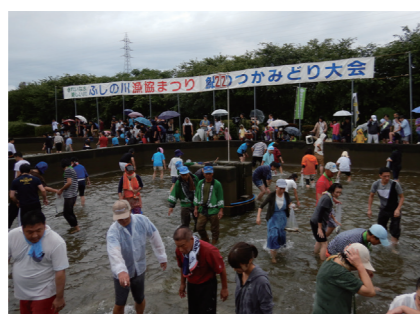
ふしの川漁協まつり