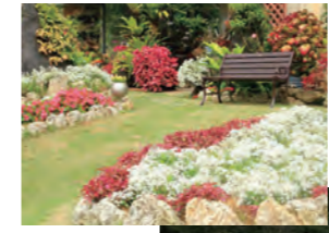
オープンガーデン