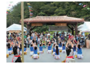
フラワーフェスティバル