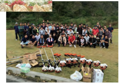
ボランティアによる道路美化活動