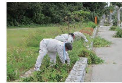
国道沿いの除草活動

に開催するとともに、地域固有の自然資源の魅力、環境保全を伝える活動として大浦川のマングローブ林を自然体験学習の場として活用するなど地域資源の魅力に磨きをかけ、人の流れを取り込み、子供から高齢者まで多様な層の人々が集い、つながり、地域の活力を再び取り戻すための取り組みを実践しています。