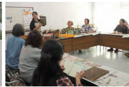
イベント準備の様子