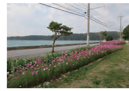
国道を彩るコスモスの花

また、各集落間を結ぶ主要道路となっている国道329号及び331号が平成23年に日本風景街道「やんばる風景花街道」として登録されたことを契機に道路美化活動や他地域との交流が活発に行われています。