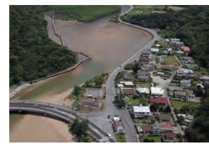
マングローブ林が広がる大浦川