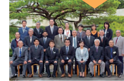
受賞者 名護市久志支部 区長会