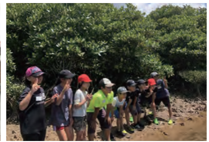
自然体験学習の様子