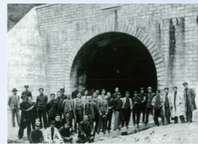
昭和時代に整備された栗子隧道(当時)