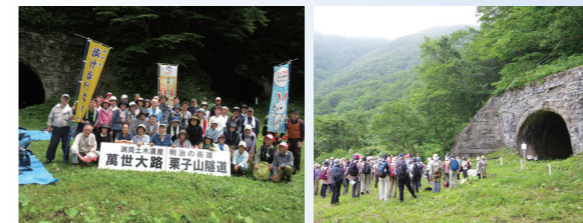
旅行会社による萬世大路ツアー

保存会による継続的な散策路の整備と情報発信の取り組みにより、県内外の旅行会社がインフラツアーを実施するようになり、地域経済の活性化にも繋がっています。地元小学生の校外学習では、子供達から「歴史を感じた」「木や植物が沢山あった」「萬世大路を守ってほしい」「普段出来ない体験ができた」といった感想が寄せられています。また民間ツアー参加者からは「昔の人が歩いたままの空気感を感じ、非常に感動した」といった声もいただいております。多くの方々に萬世大路の魅力が伝わっています。