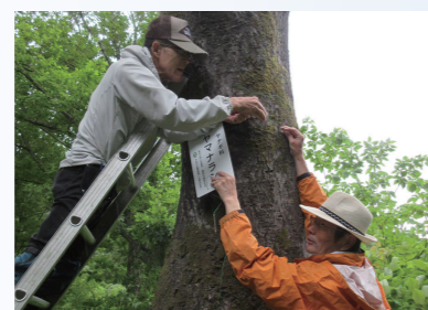
自然観察の環境を整備(樹木等に名札を設置)