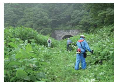
散策路の保全活動

豊かな自然を体感できる場を提供しています。さらに学習・交流活動として、外部講師を招いた勉強会や福島県側の団体との交流を通じて知識の深化を図っています。加えて、「道の駅米沢」の萬世大路紹介コーナーでは、デジタルサイネージやジオラマ、パンフレット等を設置し広く情報発信にも取り組んでいます。