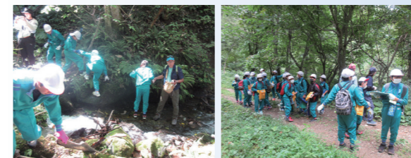
地元小学生の校外学習