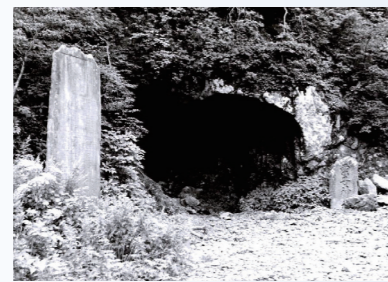
明治時代に整備された栗子山隧道(当時)