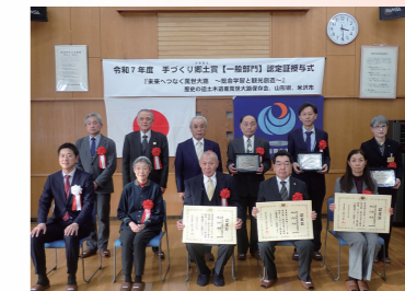
受賞者 歴史の道土木遺産 萬世大路保存会