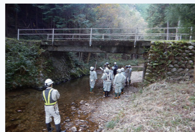
既存不適格橋を確認する自治体職員