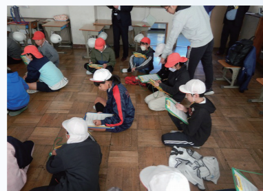
橋のクイズに挑戦する児童