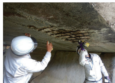
職員による防錆処理等のDIY研修

る取組の重要性を改めて痛感しました。このため、令和6年度には、小学校5・6年生を対象に、インフラメンテの必要性を理解するための座学と児童による高欄塗装実習を行う体験イベントを開催しました。イベントの実施にあたっては、児童が実際に橋を塗り替えるなど、地域インフラに対する関心と愛着を育む取組となるよう配慮しました。