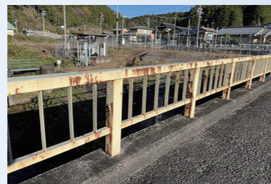
補修前の高欄の状況