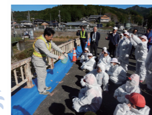
専門業者から技術指導