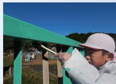
真剣な眼差しで塗装する児童