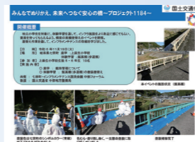
国土交通省がXに投稿