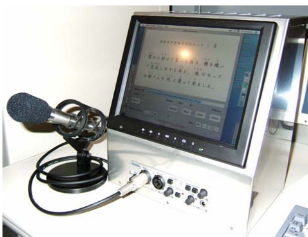
デスクトップ型試作装置

また、本システムの実用化に向けては、発話音声収録用マイクロフォンによって収録された環境雑音の適切な処理法の開発や、マイクロフォンの品質確保・向上と低価格化を同時に解決することも、解決すべき課題である。