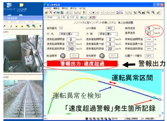
モニタリングシステムからの警報状況