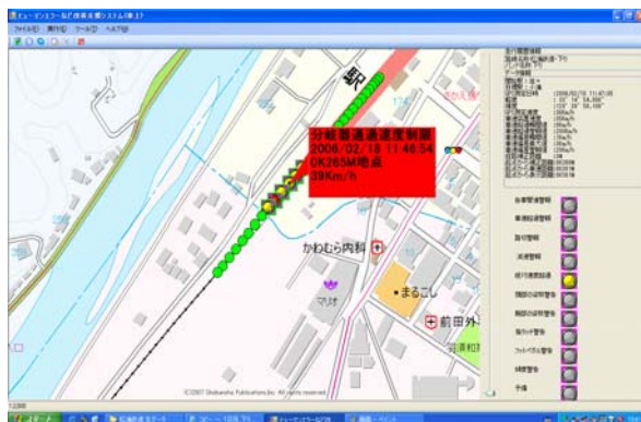
運転状況の地図上での再生（鉄道での例）