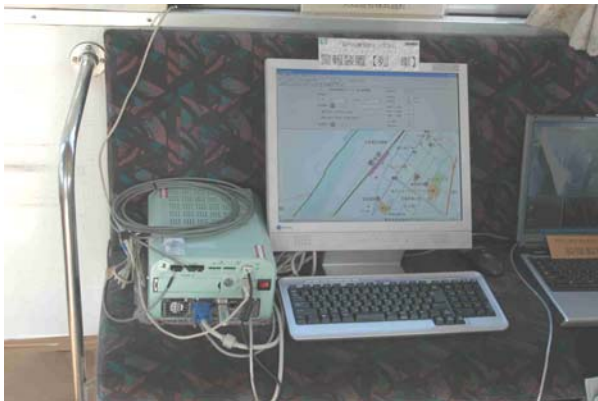
試作したモニタリングシステム

本システムでは、標準的な運転操作と実際の運転操作との乖離を検知して注意を喚起するが、ヒューマンエラーによりどの程度の乖離が発生するかを把握することが判断基準を設定する上での課題となる。現状では、乖離の程度により注意を喚起するレベルを階層化することで対応しているが、今後は、さまざまな実運転パターンを取得して、標準的な運転操作との乖離状況とヒューマンエラーの関係を明らかにすることが必要である。