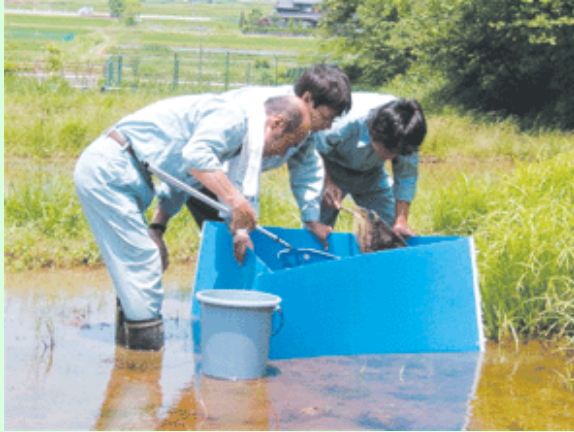
生物等のモニタリング