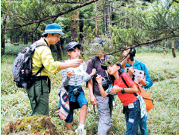
自然環境学習の様子

全体構想の対象区域で、自然環境学習を実施する時は、実施計画で具体的な自然環境学習プログラムを整備するように努めます。