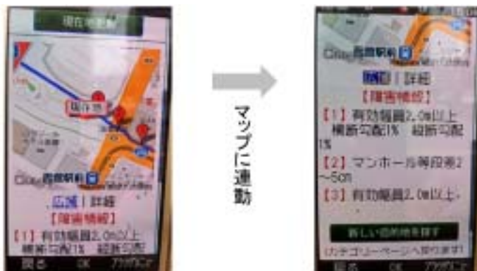
図3 経路上のバリア情報

現在位置が変わる毎に、目的地までのルート上にある幅員や段差、勾配等のバリアがある位置やバリアの内容をリアルタイムに表示