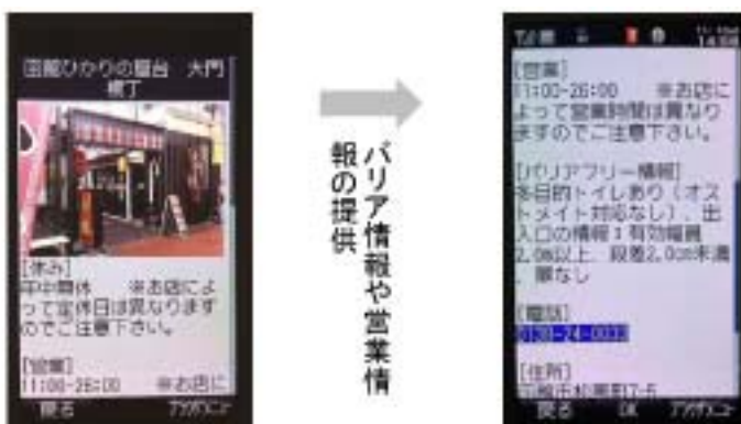
図4 施設のバリア情報や営業情報

住所や開館時間、電話番号等の一般的な施設情報の他、施設出入口の幅員や段差、多目的トイレの有無など、バリア情報についても提供