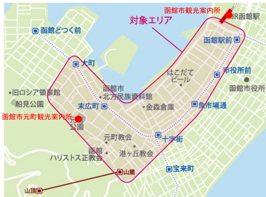
図 5 サービス対象エリア

サービス対象エリアは、函館駅前から西部地区にかけてのエリア（図 2 参照）となっています。