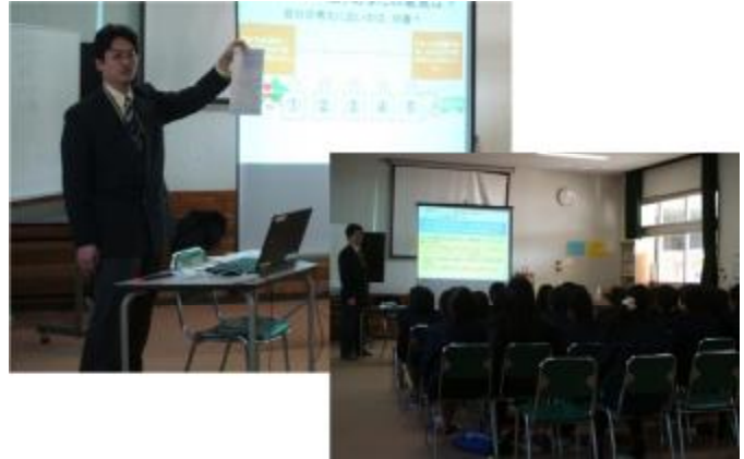
写真 2 出前講座でのリーフレット活用