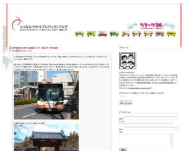
図 3 エコなおでかけプロジェクトブログ

このキャンペーンを広く知っていただくために、大阪府で公式ホームページを開設し情報発信をしています( http://www.pref.osaka.jp/toshikotsu/buseco/index.html )が、行政のホームページだけでは、利用者目線からの魅力が伝えにくくなってしまいます。当協議会事務局である NPO 法人大阪府民環境会議においてブログを立ち上げ( http://busecofamily.blog75.fc2.com/ )、キャンペーンの魅力伝えるツールとして活用しています。実際にキャンペーンに参加される府民(利用者)に公共交通利用行動を促すためには、公共交通(バス)の魅力伝え、バスを好きになってもらうことが大切だと考えています。このようなことから、事務局ではブログを作成し、バス魅力を伝えることにより、府民のみなさまがバスに乗ってみようと思う「きっかけ」「気づき」を提供しています。