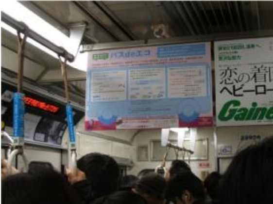
写真 1 車内吊りポスター掲示

地下鉄車内でのポスター掲出状況(写真 1)です。述べ 1 か月以上掲出されました。また、リーフレットは、小学校での出前講座「交通環境学習」で自らも「教材」としても活用しました(写真 2)。