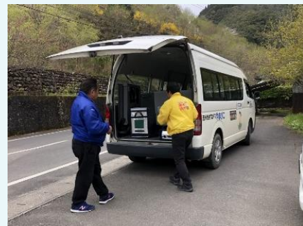
バスへの荷物の積み込み風景