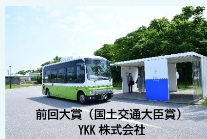
前回大賞(国土交通大臣賞) YKK株式会社