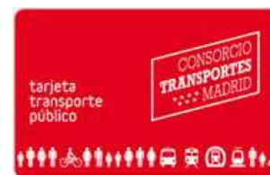
非接触型ICカード、定期券・回数券も同じデザイン