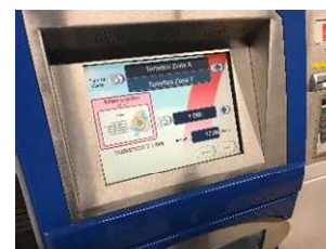
券売機で購入可能、クレジットカードでの支払いも可能