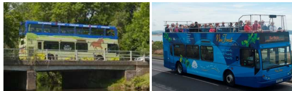
フォレストバス（左）とニューフォレストツアーバス（右）