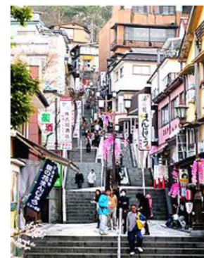
本文より （伊香保と言えばこの風景）

http://www.mlit.go.jp/sogoseisaku/soukou/soukou-magazine/1212ikaho.pdf