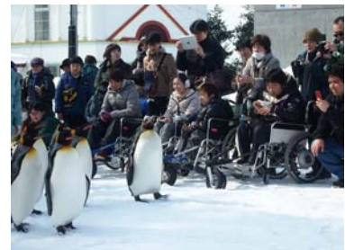
本文より (旭山動物園の有名なイベント)

その旭山動物園において進められている取り組み、来園される100人100様の方々にそれぞれ楽しんで頂ける様、行きたい所にご自身の備える対応力に応じたバリアを避けた活動を可能とするパーソナルバリアフリーを進める仕掛け(「平成24年度ユニバーサル社会に対応した歩行者移動支援に関する現地事業」)をご紹介します。