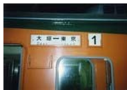
今は懐かし、この列車に絡んだご出身です

http://www.mlit.go.jp/sogoseisaku/soukou/soukou-magazine/1302shituinn.pdf