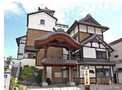
本文より (いわき湯本と言えばこの風景)

http://www.mlit.go.jp/sogoseisaku/soukou/soukou-magazine/1302iwaki.pdf