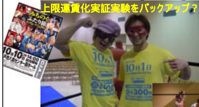
上限運賃化Tシャツの効果か、メインイベント のタイトルマッチで、タッグ王座防衛！！