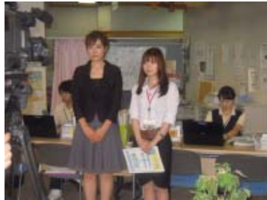
「市内300円上限運賃」と「まちパス300」を紹介する八戸 テレビ放送のキャスターと八戸市交通部営業担当職員