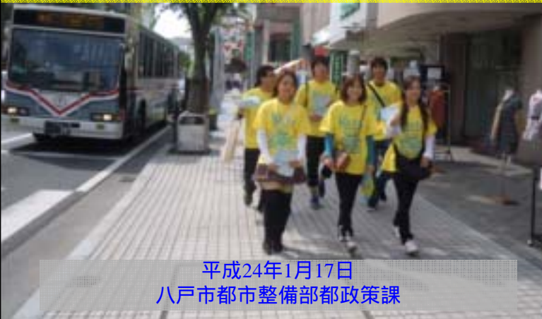
平成24年1月17日 八戸市都市整備部都政策課