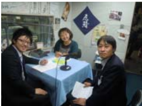
地方公営企業(八戸市交通部)と民間バス会社(南部バス) の営業担当が上限運賃化をPR