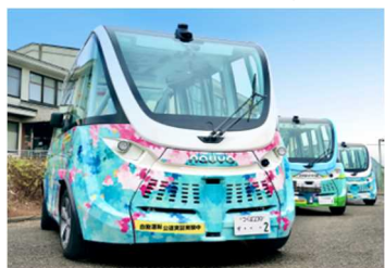
▲茨城県境町の自動運転バスの運行