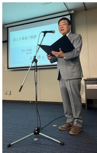
古川副大臣ご挨拶@東京