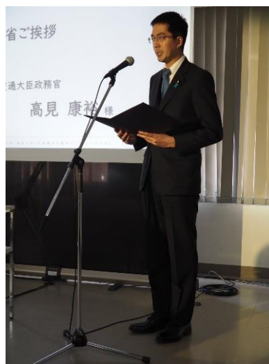
高見政務官ご挨拶@岡山