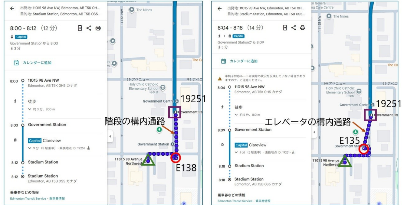
カナダ・エドモントンの地下駅のGoogle乗換案内の例 左図は通常モード、右図は車いすモードの検索結果 右図ではエレベータを利用できるE135の出入口から入るルートを案内

※Pathwaysを設定する場合には、stops.txtに乗り場(location_type=0)のほか、親station(location_type=1)、出入口(location_type=2)、汎用ノード(location_type=3)を設定する必要があります。