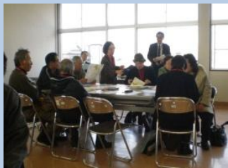
郊外におけるワークショップ