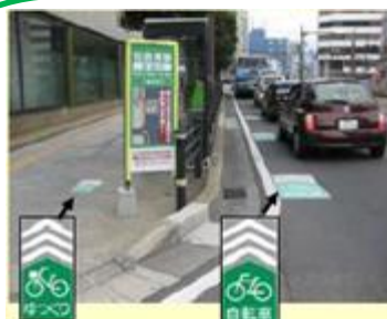
自転車利用促進社会実験