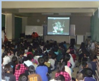
小学校における環境学習