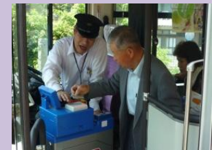
高齢者へのバスの乗り方教室