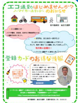
市職員の エコ通勤の 取り組み