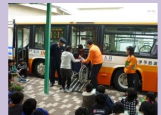
小学生へのバスの乗り方教室