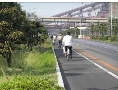
構内の歩行者・自転車レーン整備