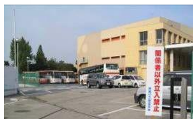
通勤バス専用車庫