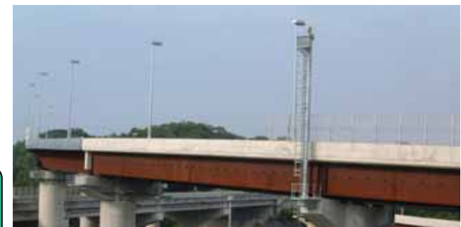
(参考：耐候性鋼材を採用した橋梁例)