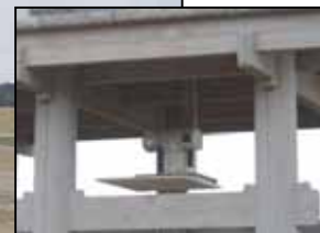
ITの活用による施設管理