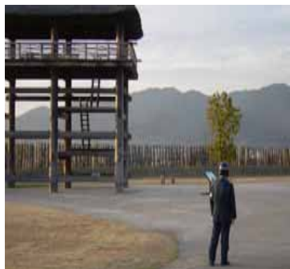
監視員等による施設管理

効果： 公園管理センターで一括監視・情報の集中管理。 映像記録の活用による施設管理や危機管理機能の強化。 10年間のコスト比較 252百万円から163百万円に縮減 (縮減額 89百万円、縮減率 約35%)