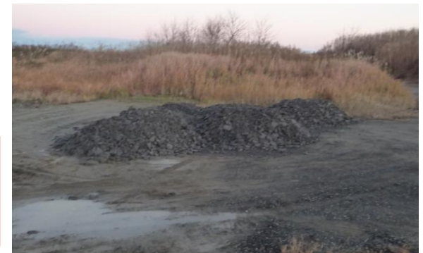
切削屑の脱水状況