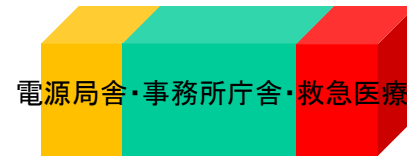
電源局舎・事務所庁舎・救急医療車庫